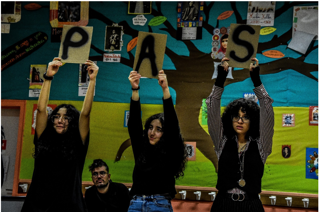
Des adolescentes de Noisy le Sec (93) lors d'un des ateliers autour du spectacle

Ce travail a ensuite été repris en atelier théâtre avec des volontaires ados et adultes pour les associer au travail de recherche autour de la création.