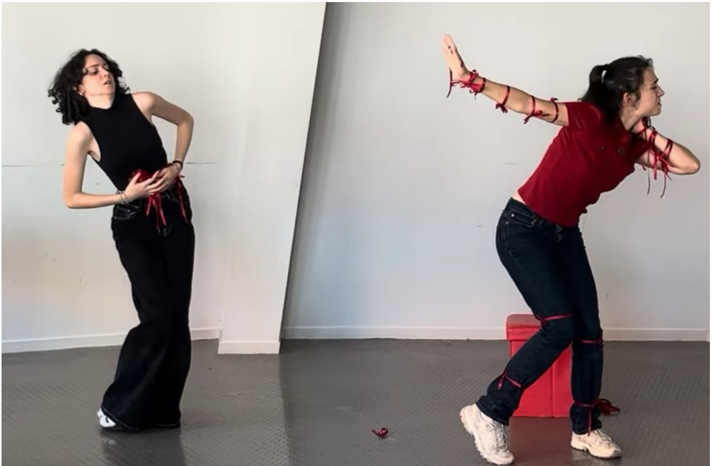
Des rubans rouges qui symbolisent les blessures invisibles accumulées

Le Petit Chaperon se pare de rubans rouges jusqu'à en être presque recouverte à la fin de la pièce. Ces rubans témoignent de toutes les petites blessures invisibles que l'on porte avec soi, parfois même sans en avoir conscience. Ce sont toutes les petites remarques qui s'accumulent, les complexes aussi... Le Petit Chaperon Rouge finira par dénouer tous ses nœuds dans une danse libératrice , pleine d'une colère saine et joyeuse. Et une fois la pièce terminée, les actrices invitent le public à eux aussi nouer un ruban rouge en pensant à une personne victime de violence.