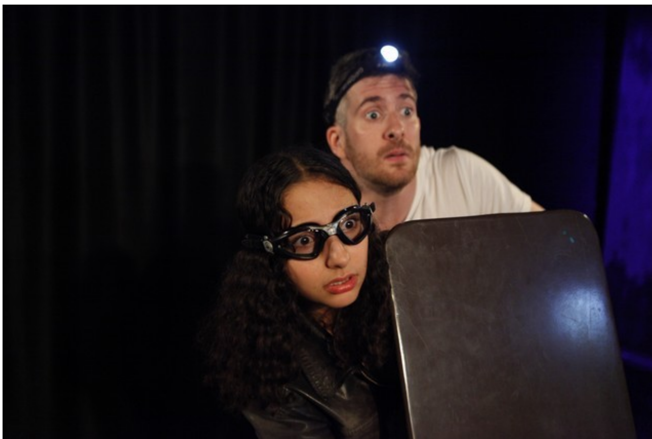
Un affrontement devant un palais

Sayyida deviendra reine pirate. Arabo-andalouse, elle se bat pour préserver la mémoire, la science et la culture de la défunte Al-Andalous. Mais son combat vise aussi à constituer une nouvelle société, plus juste et accueillante pour tout le monde.