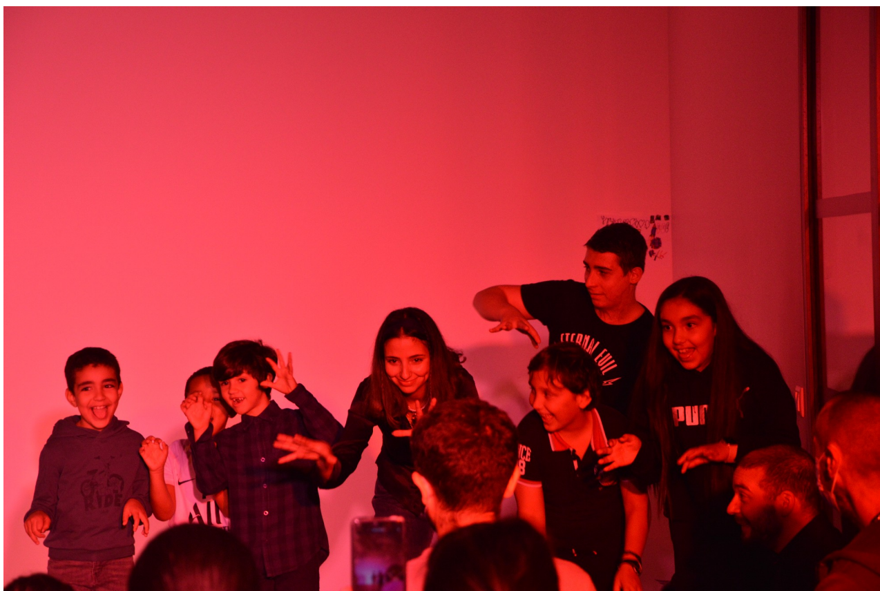
Atelier intergénérationnel autour du spectacle

Que ce soit des lectures, des répétitions ouvertes ou des ateliers de théâtre, nous sommes toujours ravi de rencontrer les publics locaux de tous âges.