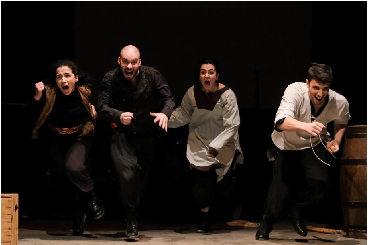
Un affrontement devant un palais

Sayyida al Hurra, « La Dame Libre » femme arabo-andalouse, se bat pour préserver la mémoire , la science et la culture de la défunte Al-Andalous. Mais son combat vise aussi à constituer une nouvelle société, plus juste et accueillante.