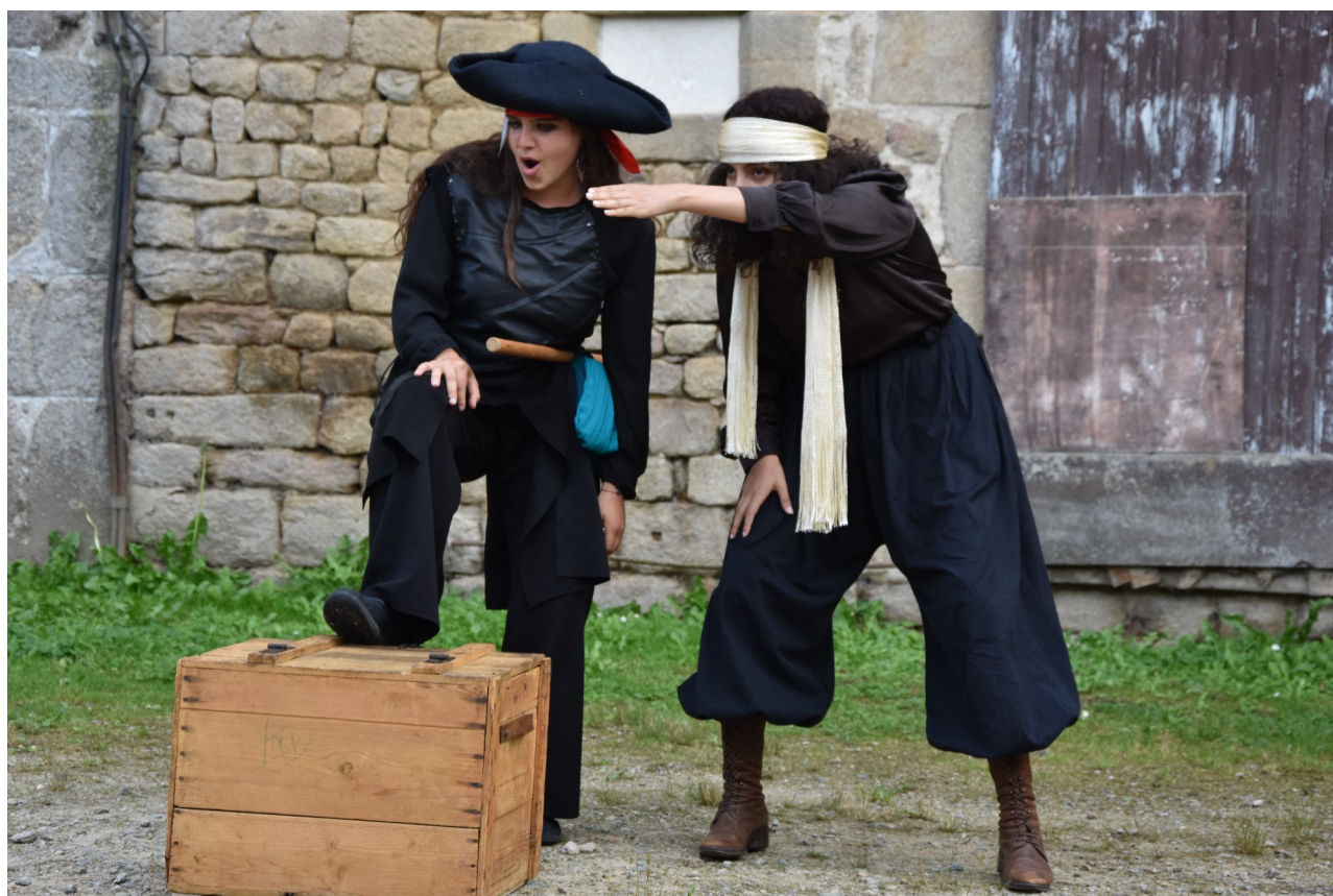
Représentation à Eymoutiers (87) Les pirates planifient leur assaut