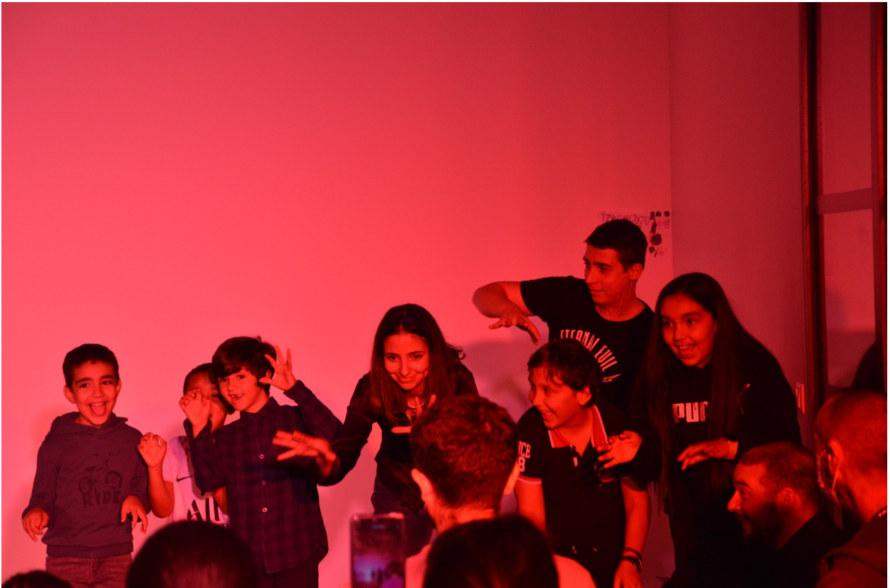
Atelier intergénérationnel autour du spectacle

Que ce soit des lectures, des répétitions ouvertes ou des ateliers de théâtre, nous sommes toujours ravi de rencontrer les publics locaux de tous âges.