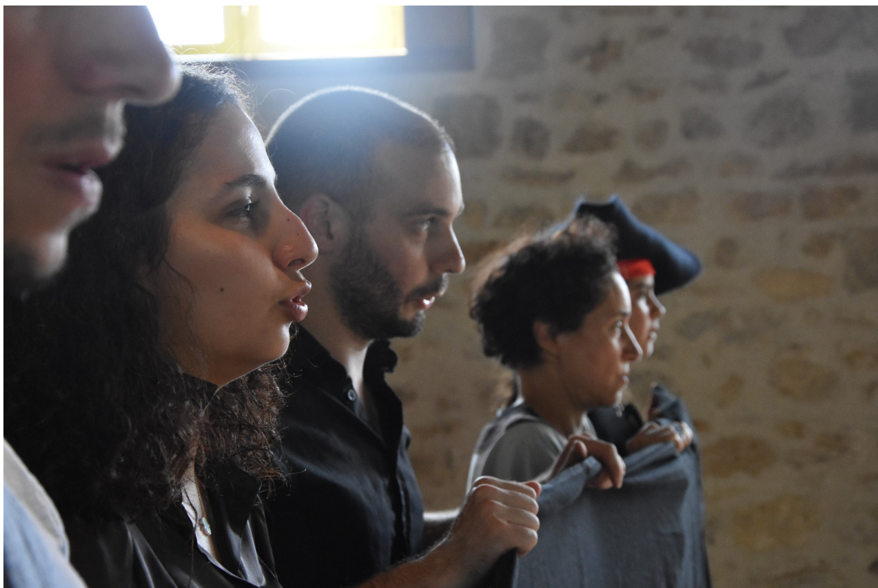
Représentation à Faux la Montagne, L'équipe se tient derrière une banderole « No Borders » pour le texte final